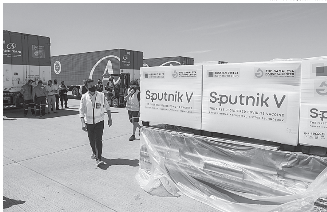
Ao menos 14 Estados e 2 municípios solicitaram a importação do imunizante

O diretor relator do caso, Alex Machado, acolheu os argumentos das áreas técnicas e manifestou especial preocupação com a identificação do adenovírus replicante na vacina. “A própria vacina foi desenvolvida para que o adenovírus