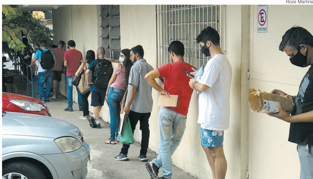
Fila na porta dos Correios de Barra Mansa gera reclamação de quem precisa esperar por atendimento