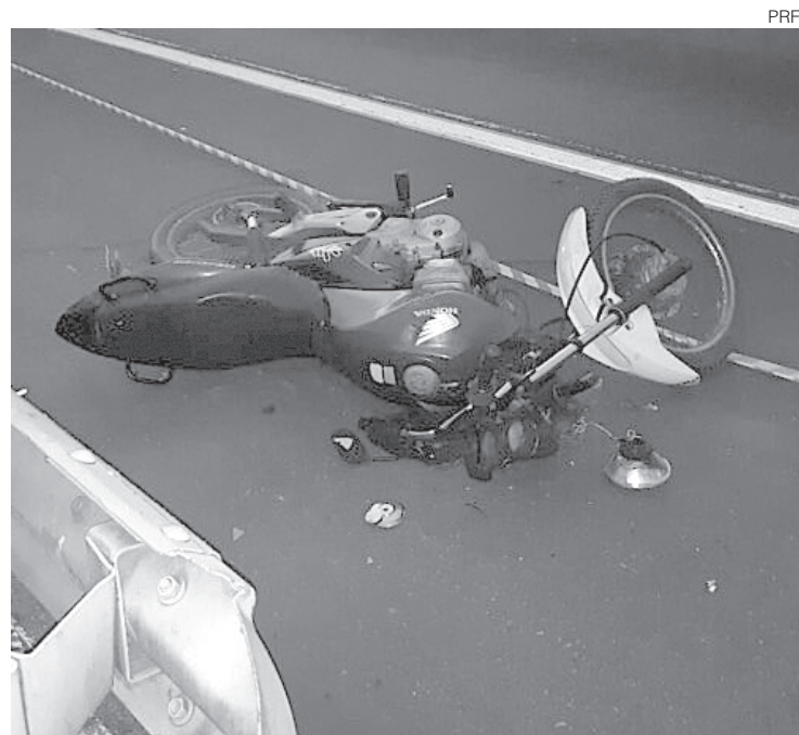
Veículo foi encontrado abandonado no acostamento da Dutra

A PRF informou que o condutor do veículo, bem como testemunhas, não foram encontrados. Os agentes relataram que realizaram inspeção veicular minuciosa na motocicleta, e não constaram registro de ocorrência de roubo ou furto para o veículo. Também foi informado que o local foi preservado para a perícia da Polícia Civil e, após todo material ser recolhido, tanto as munições deflagradas, quanto a motocicleta, foram apresentadas na 100ª DP (Porto Real), que passa a investigar o caso.