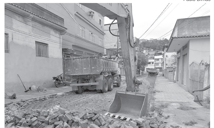
Prazo de finalização é de 45 dias

A Secretaria de Manutenção Urbana, está realizando a retirada de bloqueios da Rua Tenente Luis Fernando, no bairro Vila Orlandélia, com o intuito de fazer a base e aplicar asfaltamento no local. A obra teve início na terça-feira (27) e o prazo para finalização é de 45 dias.