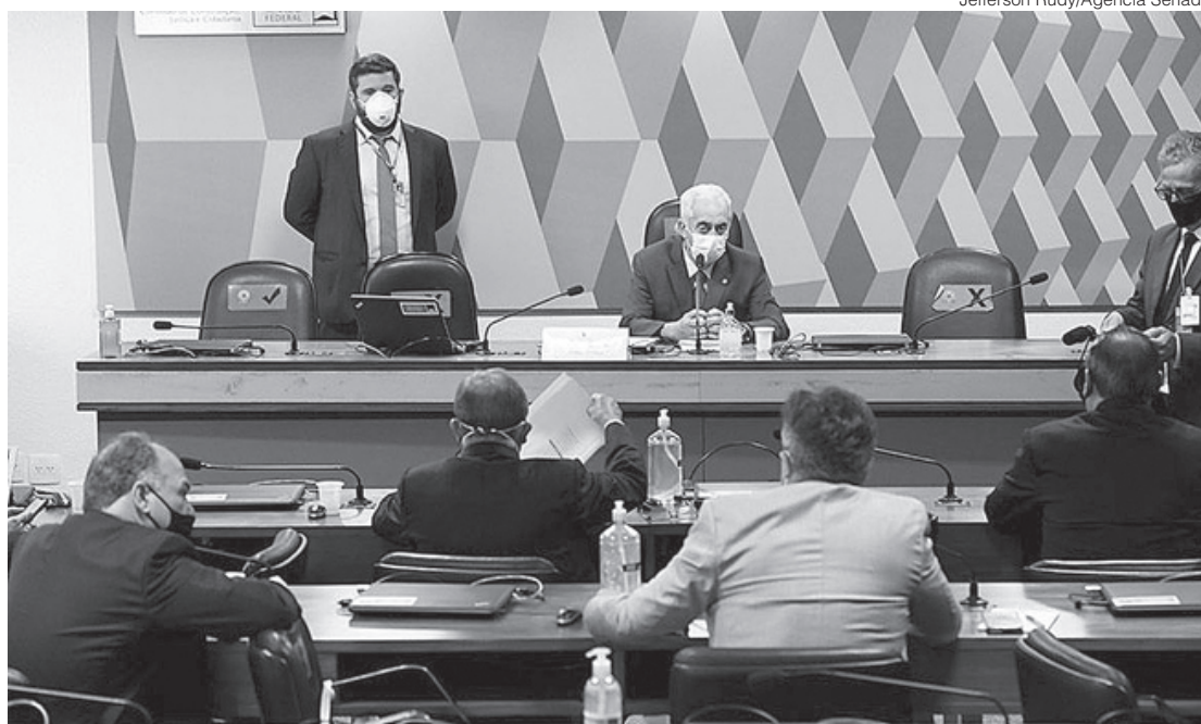
Ao assumir a presidência da CPI, o senador Omar Aziz se comprometeu em conduzir os trabalhos de forma técnica