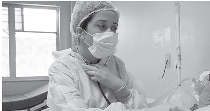
Pacientes recuperados da Covid-19 recebem tratamento de fisioterapia respiratória