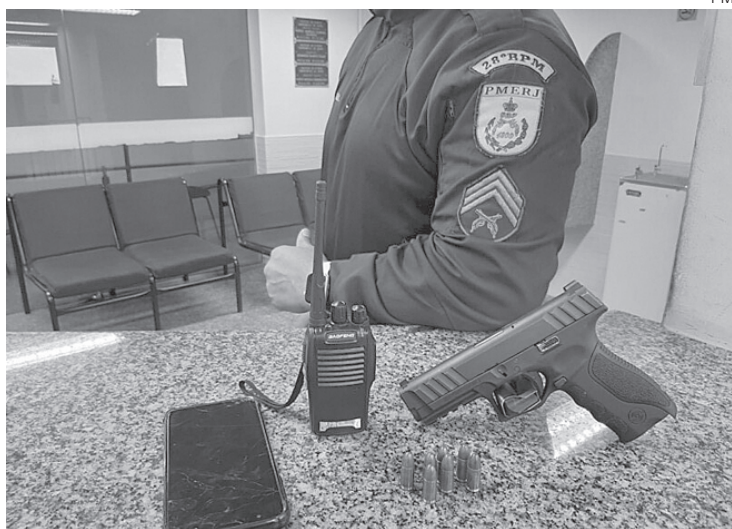
Material apreendido foi entregue na 93ª DP

Um homem, de 28 anos, considerado foragido da Justiça, foi preso por policiais do Serviço Reservado da Polícia Militar na tarde de segunda-feira, dia 26, na Radial Leste, no bairro Niterói, em Volta Redonda,