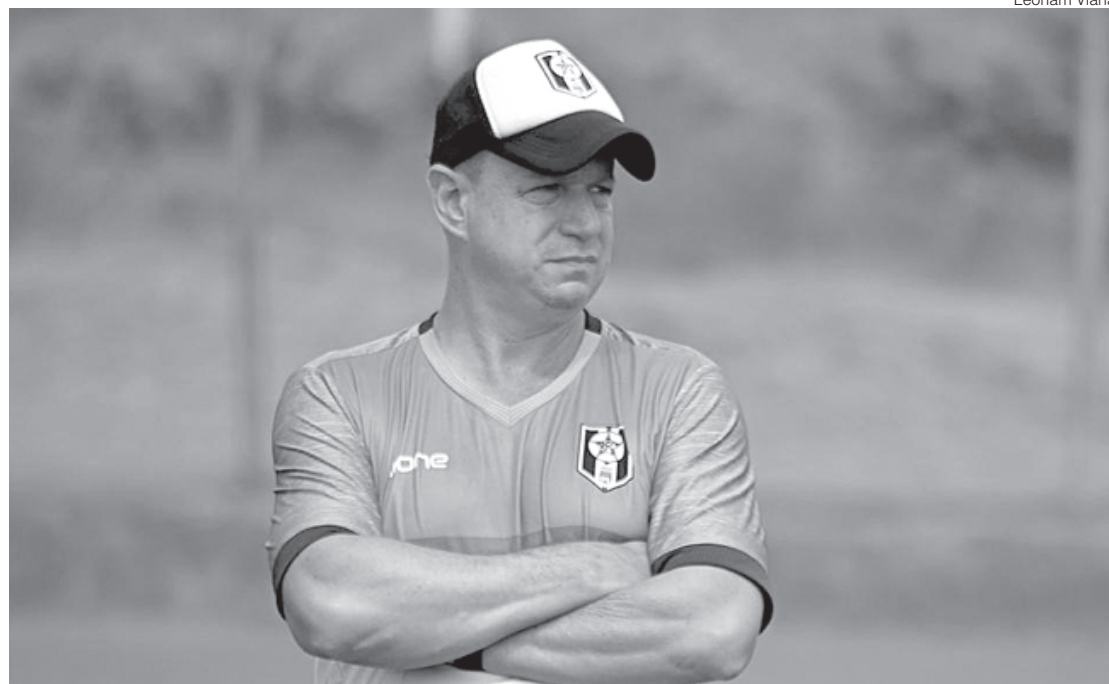
Treinador já passou por duas categorias de base e atualmente vê promessas que lapidou se tornando realidade

Foram dois anos maravilhosos. A gente passou desde o sub-17 e estamos ainda em processo de implementação da metodologia, mas acredito que muitos deles já assimilaram bastante e a resposta está aí. Jogamos uma carioca com mais atletas da base do que contratados e conseguimos honrar a insti-