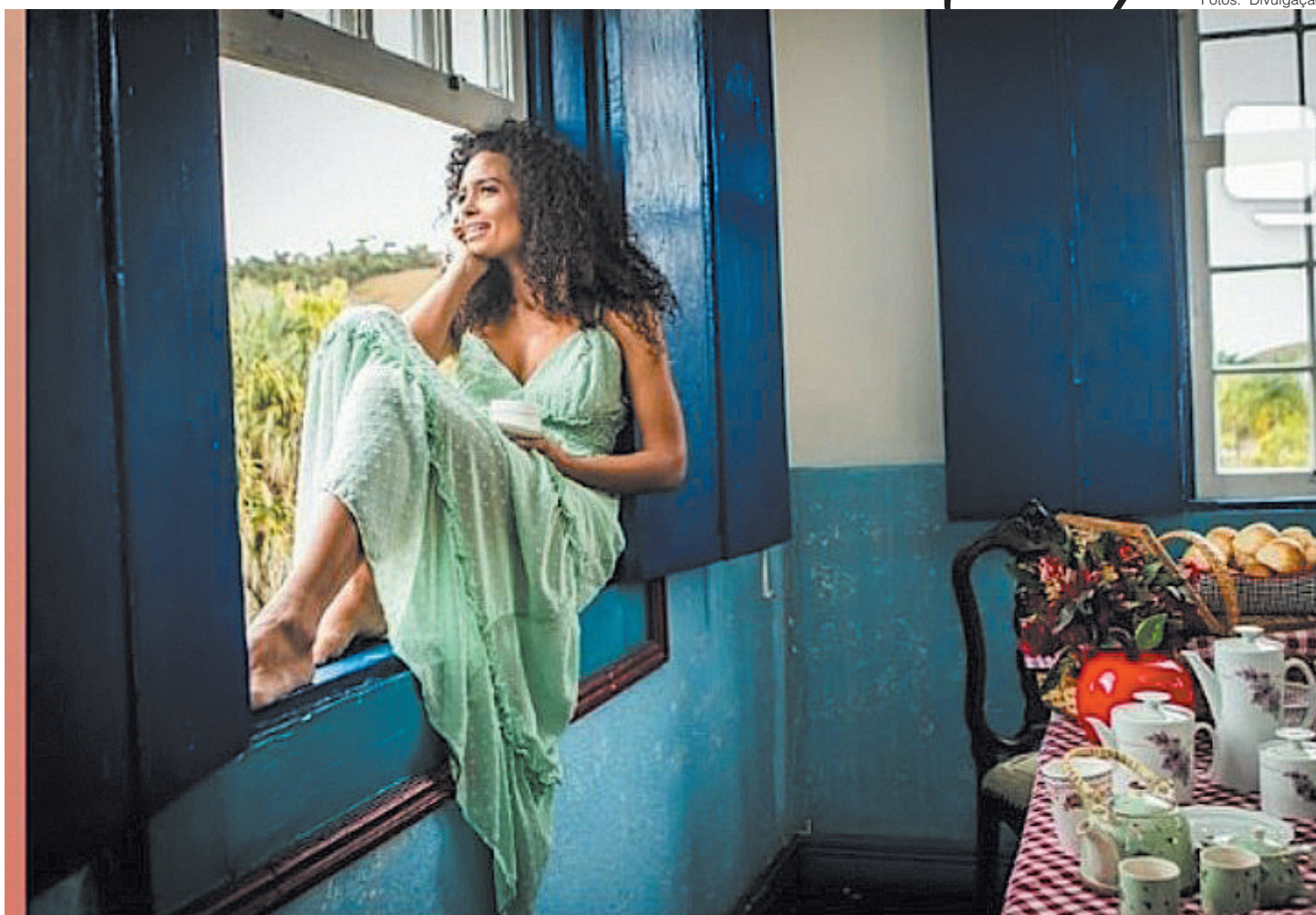
A atriz Aisha Jambo, num 'revival' de seu personagem Ritinha na novela Cabocla